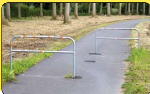
Betere doorgang voor fietsers

Die stonden vervaarlijk dicht bijeen, fietsers bezeerden zich aan de sluisen. Ze hadden ze te laat gezien of hun snelheid slecht ingeschat voor de erg smalle doorgang. Het gemeentebestuur beloofde de zaak nader te zullen bekijken. Toen dat wat lang duurde, legde het Vlaams Belang de zaak nog eens voor op de Verkeerscommissie. Uiteindelijk heeft dat dan toch effect gehad. De doorgang tussen het paalwerk is een stuk breder gemaakt.